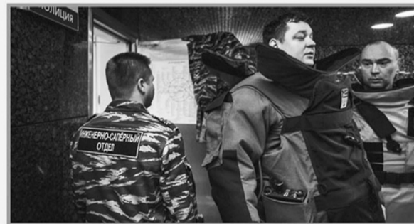
Изготовлено по заказу Главного управления региональной безопасности Тверской области в рамках реализации Государственной программы Тверской области «Обеспечение правопорядка и безопасности населения Тверской области» на 2013–2018 годы

Террористы, как правило, устанавливают взрывные устройства в жилых домах и общественных местах, на дорогах, в метро, на железнодорожном транспорте, в самолётах, припаркованных автомобилях. В настоящее время могут использоваться как промышленные, так и самодельные взрывные устройства, замаскированные под любые предметы.